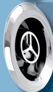
Wirujące MAX-dysze masażu stóp (refleksoterapia)

Silnie skoncentrowany strumień wodny o działaniu punktowym. Idealny do masowania mniejszych mięśni (mięśnie kończyn, mięśnie przykręgosłupowe). Efekt: rozluźnienie masowanej okolicy ciała oraz zmniejszenie bólu.