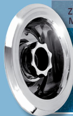
Zamykane MAX-dysze wodne

Regulowana dysza zasilana systemem POWERSTREAM – wzmocniony masaż wodno-powietrzny. Regulacja dyszy: max. przepływ: masa dużych mięśni (uda, grzbiet). Lepsze odżywienie tkanek i usunięcie produktów przemiany materii, rozluźnienie, złagodzenie bólu. – min. przepływ: masaż głębszy, punktowy, doskonały do mniejszych mięśni (mięśnie kończyn). Efekt: regeneracja tkanki.