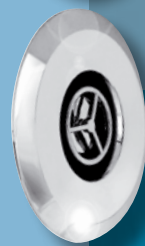
Super-dysza wodna wirująca

Wirowy strumień zwiększający ukrwienie tkanek. Przeznaczenie: – refleksoterapia (intensywne pobudzenie receptorów stóp). – masaż większych mięśni (grzbiet, pośladki, brzuch). Efekt: przekrwienie masowanej tkanki, rozluźnienie, zwiększenie elastyczności mięśni i ścięgien oraz zmniejszenie bólu.